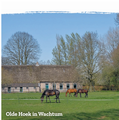
Olde Hoek in Wachstum